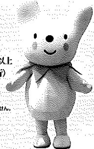
神河町マスコットキャラクターカミン